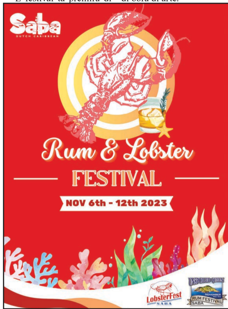
Ku honor i sertifikado

Esaki ta un kolaborashon entre diferente partner dentro di e sektor turístiko, restaurant, bar, hotèl, sentro di buseo, provedónan di transporte i eksponentenan di obra di arte.